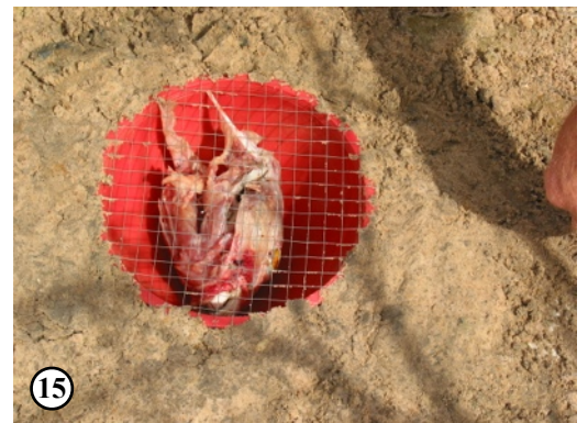
Fig. 7-10. - Lagune de Nianing, Sénégal. Fig. 11-15. - Pose d'un piège par A. Coache.